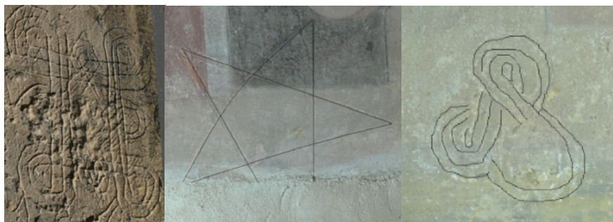
Obr. 3. Ochranné symboly, kostel sv. Petra v Lounech, kostel sv. Jakuba Většího ve Slavětíně.