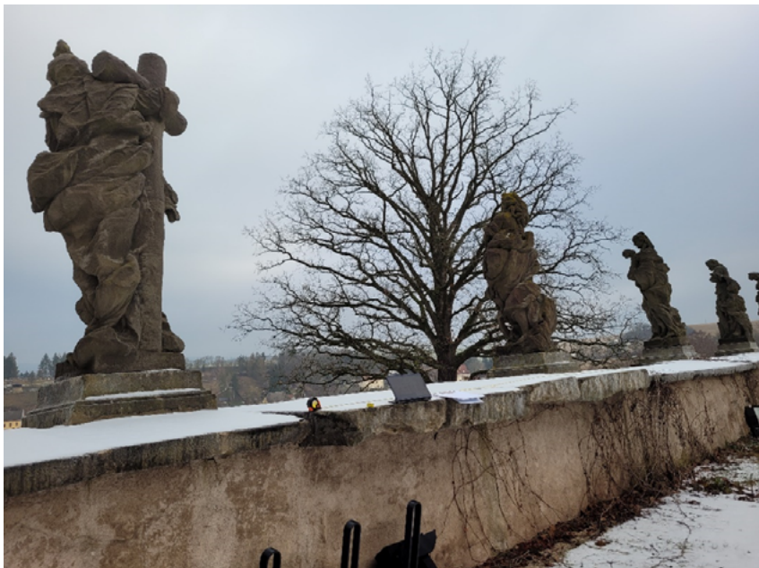
Obr. 8. Fotografie ze současnosti. Z pořízených fotografií je výrazně viditelný převis pískovcových desek, zbytky napojení v nižších místech nejsou z fotografií snadno viditelné (foto autor, 2022).