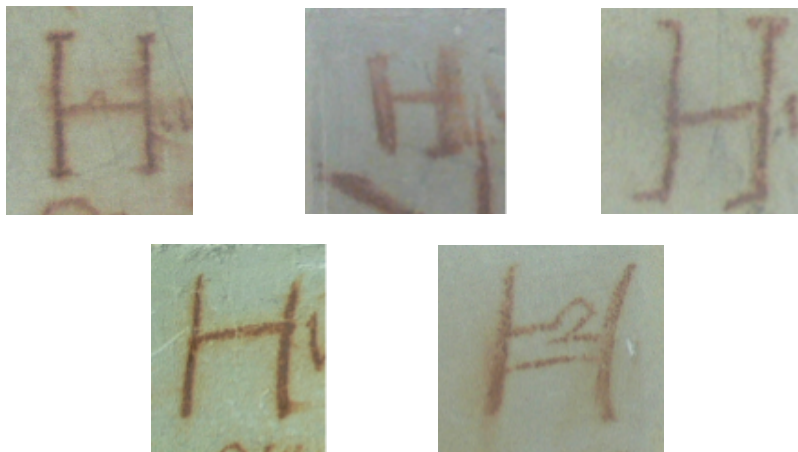
Obr. 2. Série rozdílných vyhotovení kapitální litery H, kostel sv. Petra a Pavla v Mělníku.