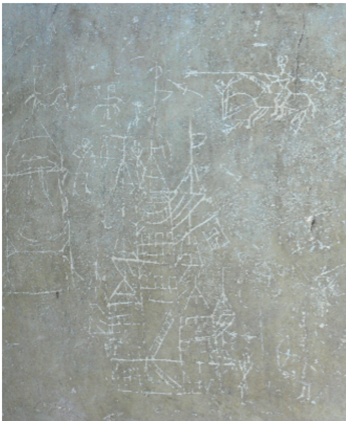
Obr. 5. Graffiti zobrazující pravděpodobně scénu dobývání hradu.