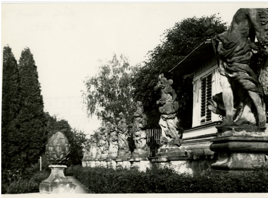
Obr. 3. Záběr na alegorie Ctností se zvonicí v pozadí, třicátá léta 20. století (NKP Kuks, nezařazená fotodokumentace, inv. č. KU 3873).