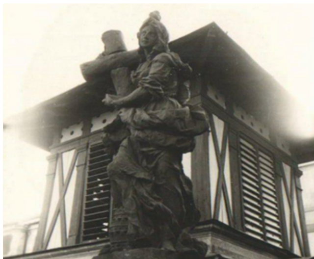
Obr. 7. Snímek z evidenčního listu nemovité kulturní památky zachycující zvonici s plastikou Víry v popředí. V tomto případě byla výjimečně zvonice zachycena vcelku významně, u zbylých fotografií tomu už tak žet nebylo (Evidenční list nemovité kulturní památky, Komplex hospitálu, 1971).