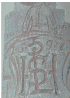
Obr. 1. Série sebezprezentačních graffiti, kostel sv. Petra a Pavla v Mělníku.